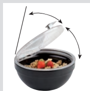
zwei Öffnungspositionen des Deckels two opening positions of the lid