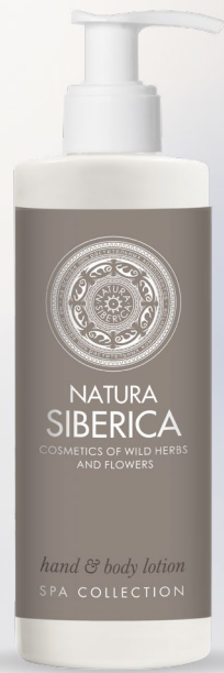
HAND & BODY LOTION 300 ml