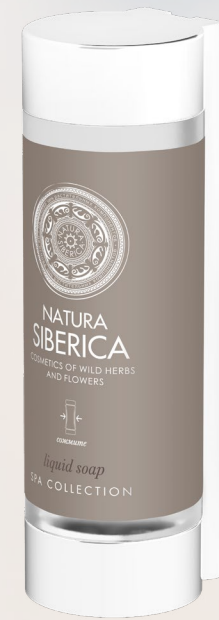
LIQUID SOAP 350 ml