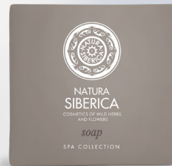
SOAP 15 G