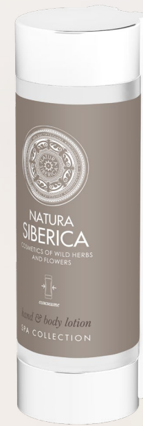
HAND & BODY LOTION 350 ml