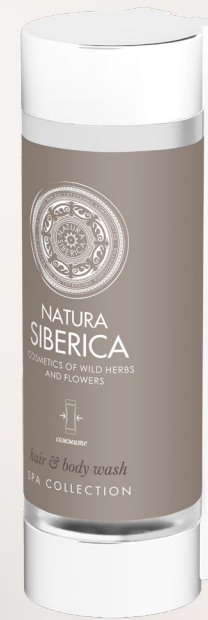
HAIR & BODY WASH 350 ml