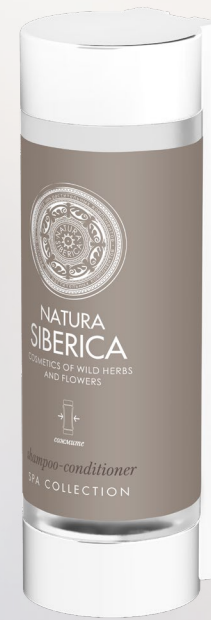
SHAMPOO- CONDITIONER 350 ml