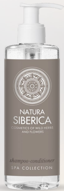
SHAMPOO- CONDITIONER 300 ml