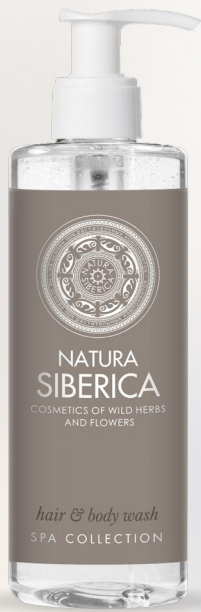
HAIR & BODY WASH 300 ml